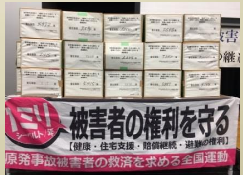
第三期請願運動に寄せられた署名の束

⇒避難・居住・帰還のいずれを選択した場合にも国が住宅等を保障する責務を負うと明記した「原発事故子ども・被災者支援法」の規定を実施することが必要です。