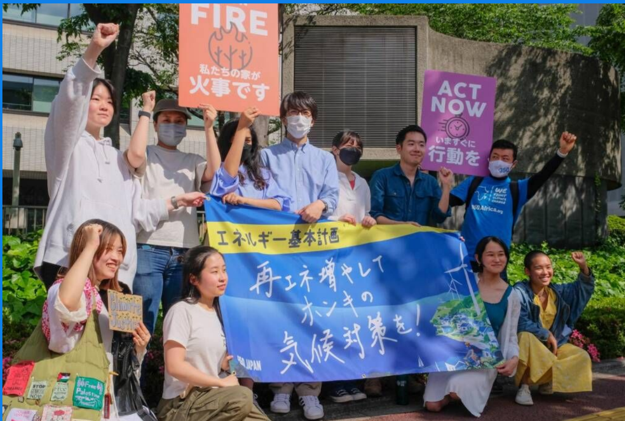
基本政策分科会にあわせた350 Japanによる緊急アクション 5月15日